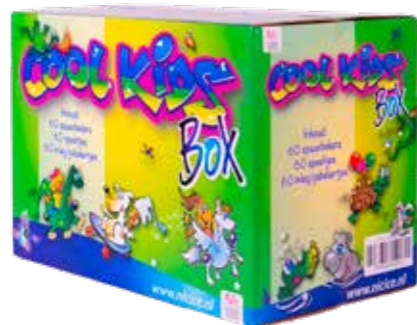
COOL KIDS BOX 60 STÜCK 50920