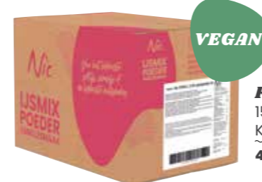
FORALL 15,9% PFLANZENFETT KARTON 14 X 1 KILO 43840

Forall ist echt für jeden Wir können den veganen Trend nicht länger ignorieren. Zum Glück ist das nicht mehr nötig, denn mit dem Eismix „Forall“, können Sie das 100% pflanzliche leckerste Softeis herstellen. Ein Geschmackserlebnis für jeden.