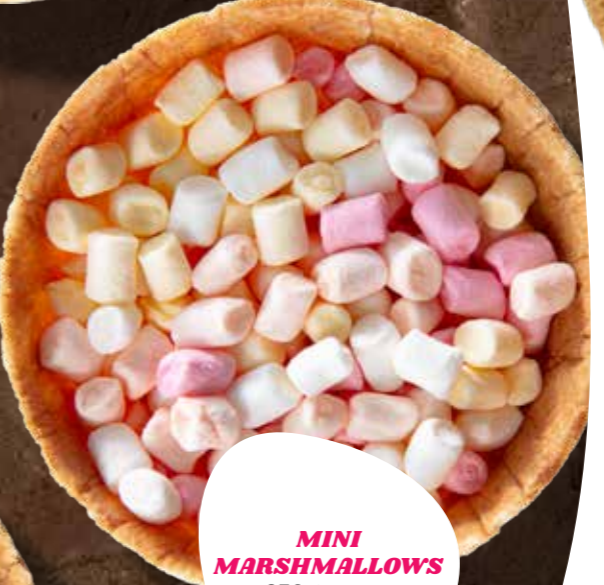
MINI MARSHMALLOWS 350 GRAMM 1330