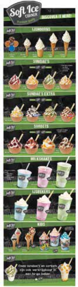
TEILKARTE SET SOFTICE CORNER 92210