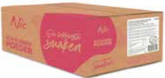
ZITRONE 0,5% MILCHFETT KARTON 10 X 1 KILO 43760