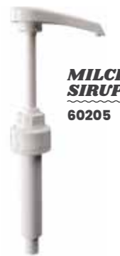
MILCHSHAKE SIRUP PUMPE 60205