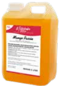
MANGO PASSIONSFRUCHT 5 X 2 LITER 60510