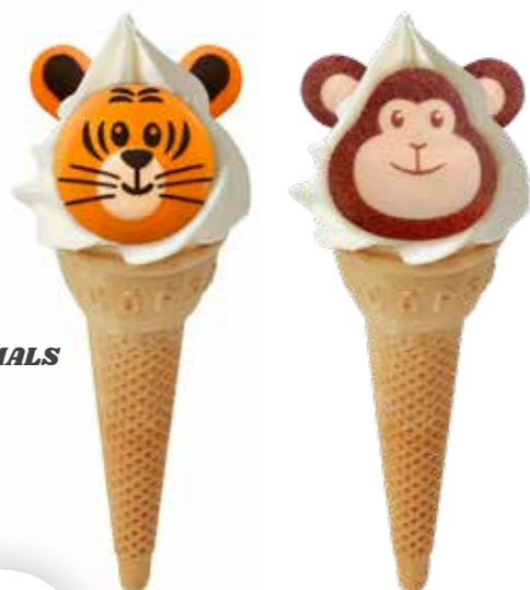
PARTY ANIMALS 56 STÜCK 2620