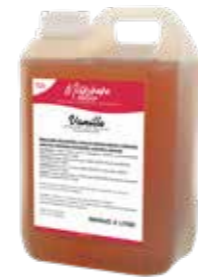
VANILLE 2300 GRAMM 60200