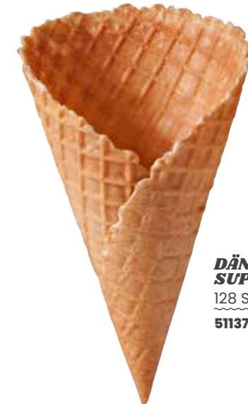
DÄNISCHE WAFFEL SUPER 90/160 128 STÜCK 51137