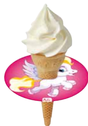
KIDS TROPFFÄNGER PONY 250 STÜCK 9900044