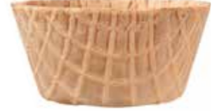
DÄNISCH CUP MEDIUM 93/45 280 STÜCK 51132