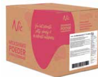
MILCHSHAKE PULVER 7% MILCHFETT KARTON 14 X 1 KILO 82060

Mit unseren Spezialmischen können Sie die leckersten Milchshakes zubereiten; erhältlich als Pulver und als flüssiges Milchshake-Mix. Sie haben eines gemeinsam; In beiden Fällen besteht die Basis aus den allerbesten Zutaten.