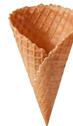
DÄNISCHE WAFFEL SUPER 90/160 128 STÜCK 51137