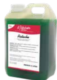
PISTAZIE 5 X 2 LITER 60470