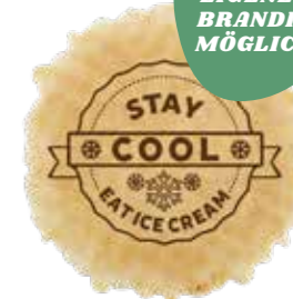
DUCATO STAY COOL Ø 60 1000 STÜCK 51126