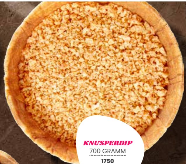
KNUSPERDIP 700 GRAMM 1750