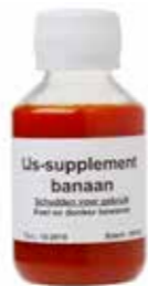
BANANEN EISMIX ADDITIV KARTON 6 X 100 ML 65005