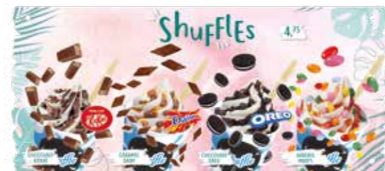
TEILKARTE SHUFFLE GOOD CHO'ICE*