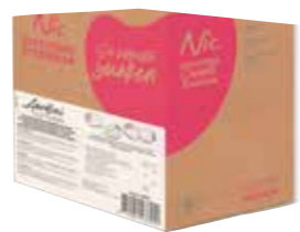
ERDBEER 6% PFLANZFETT 1 X 10 LITER / 11 KILO 43694