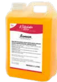
BANANE 2300 GRAMM 60220