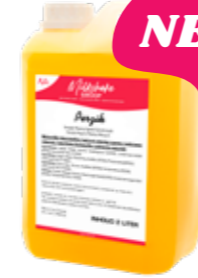
PFIRSICH 2300 GRAMM 60670