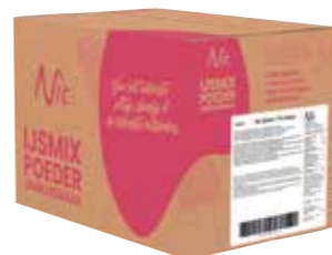
(D)ROOM 18% MILCHFETT KARTON 14 X 1 KILO 43820