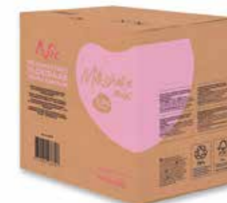
MILCHSHAKE MIX 2,5% MILCHFETT 1 X 10 LITER / 11 KILO 43670