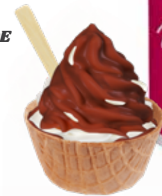
MILCH-SCHOKOLADE 1200 GRAMM 2800