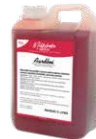
ERDBEER 2300 GRAMM 60210