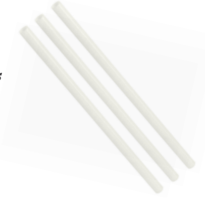
TRINKHALM 8,5 MM X 23 CM 1000 STÜCK 39210