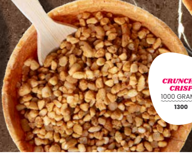
CRUNCHY CRISP 1000 GRAMM 1300