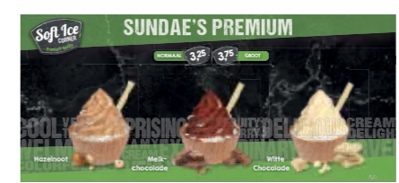
TEILKARTE SUNDAE PREMIUM SOFTICE CORNER*