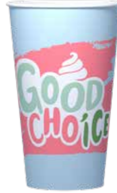
SHAKE / EISBECHER LARGE 500 ML 20 X 50 STÜCK 35230