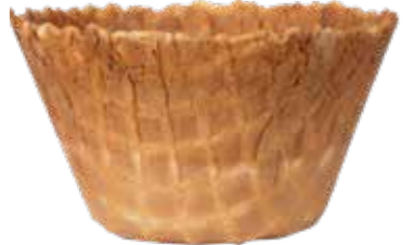
DÄNISCH CUP LARGE 97/55 240 STÜCK 51122