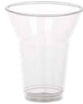
SUNDAE BECHER TULP 200 ML 20 X 50 STÜCK 51330