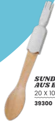
SUNDEA LÖFFEL AUS BAMBUS 20 X 100 STÜCK 39300