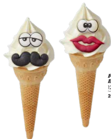
FUNNY FACE ELEMENTE 128 STÜCK 2610

Wer die Kids verführt, zieht auch ihre Eltern an. Mit unseren „Funny Faces“- und „Party Animals“-Elementen zaubern Sie Ihren jüngsten Gästen im Handumdrehen ein Lächeln ins Gesicht. Und während die Kids diese fröhlichen Eissorten genießen, bestellen die Eltern die luxuriösesten Eiskreationen für sich. Zählen Sie Ihre Gewinne! Vergessen Sie nicht die Cool Kids-Aufbewahrungsbecher. Das Design wurde angepasst, so wie die Überraschung. Auf diese Weise sorgen Sie weiterhin für Innovationen und Überraschungen!