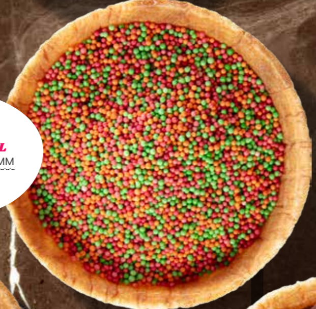
DISCO SPEZIAL 2000 GRAMM 1220