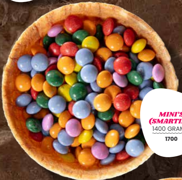
MINI'S (SMARTIES) 1400 GRAMM 1700