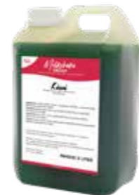
KIWI* 5 X 2 LITER 60240