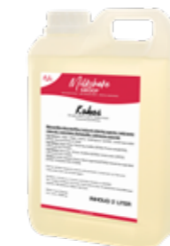
KOKOS 5 X 2 LITER 60290