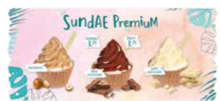
TEILKARTE SUNDAE PREMIUM GOOD CHOICE*