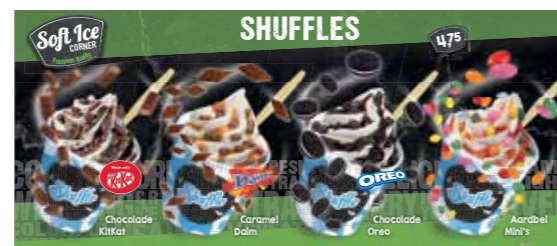
TEILKARTE SHUFFLE SOFTICE CORNER*