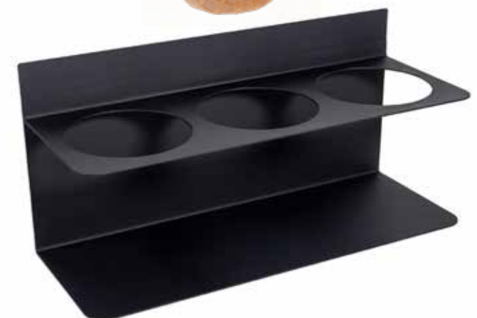
PREMIUM DIP STÄNDER 95210