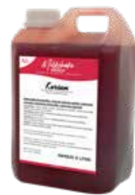
KIRSCH 5 X 2 LITER 60310