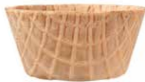
DÄNISCH MEDIUM CUP 93/45 280 STÜCK 51132