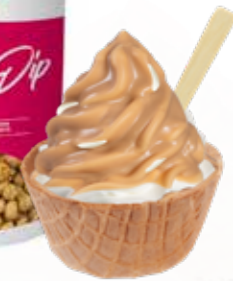
HASSELNUSS 1200 GRAMM 2810