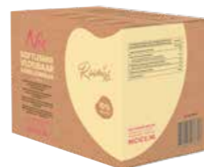
PREMIUM EISMIX 10% 10% MILCHFETT 1 X 10 LITER / 11 KILO 45670