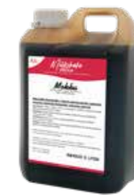
MOKKA 5 X 2 LITER 60300