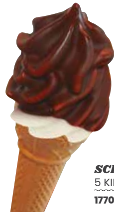
SCHOKO-PUR 5 KILO 1770

Der klassische Dip ist noch immer sehr beliebt. Erhitzen Sie die Blöcke im Bain Marie und verleihen Sie Ihrem Softeis einen köstlich knusprigen Überzug.