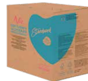
STANDARD 7% PFLANZENFETT 1 X 10 LITER / 11 KILO 43665