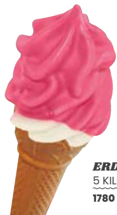
ERDBEER 5 KILO 1780