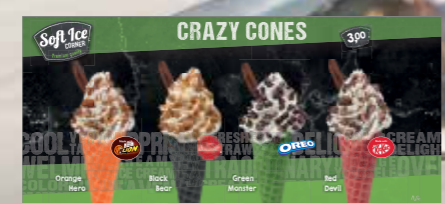
TEILKARTE CRAZY CONES SOFTICE CORNER*