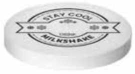
DECKEL MILCHSHAKE BECHER T.B.V. 300/400/500 ML 20 X 50 STÜCK 32100