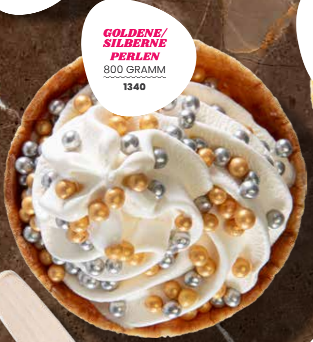
GOLDENE/SILBERNE PERLEN 800 GRAMM 1340