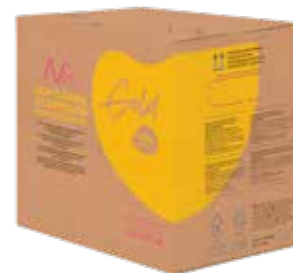
GOLD EISMIX 10% MILCHFETT 1 X 10 LITER / 11 KILO 43663

Unsere flüssigen Eismixe im neuen Design. Gemäß unserer Philosophie „Umweltbewusst“ wählen wir so viel wie möglich Verpackungen aus recycelbaren Materialien. Im Jahr 2024 erhalten Sie unsere flüssigen Eismixe im neuen Design, verpackt in einem recycelbaren Karton und recycelbaren Plastiktüte. Darüber hinaus sind unsere bewährten Softeismixe noch besser als echte Nic- Produkte erkennbar*.