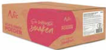
YOGHURT 13% PFLANZFETT KARTON 10 X 1 KILO 43750