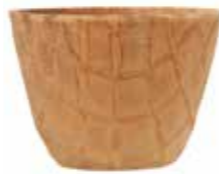
DÄNISCH MINI CUP 53/39 160 STÜCK 51109