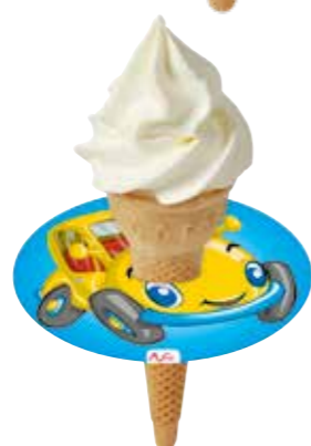
KIDS TROPFFÄNGER AUTO 250 STÜCK 9900043