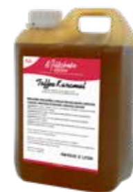
TOFFEE KARAMELL 5 X 2 LITER 60490