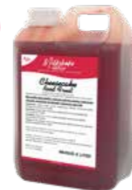
CHEESECAKE ROTE GRÜTZE 2300 GRAMM 60570