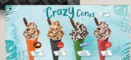
TEILKARTE CRAZY CONES

SCHWARZE WAFFEL MIT VANILLEGESCHMACK 48/155 140 STÜCK 51097