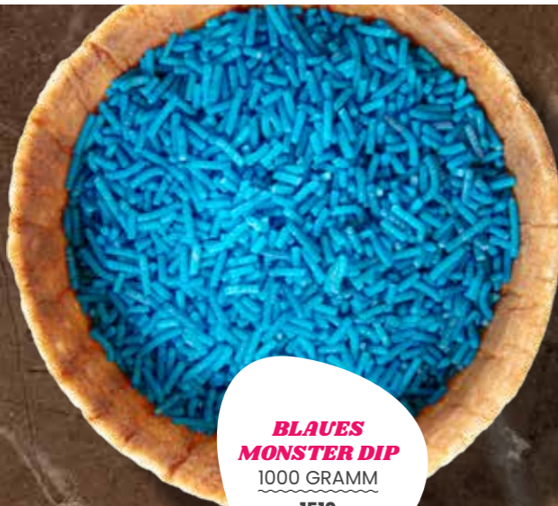
BLAUES MONSTER DIP 1000 GRAMM 1510