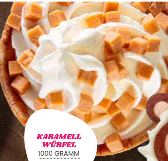
KARAMELL WÜRFEL 1000 GRAMM 3110