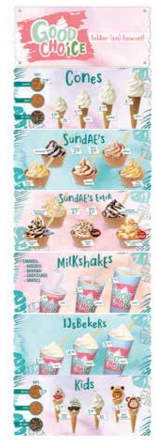
TEILKARTE SET GOOD CHO'ICE 92230