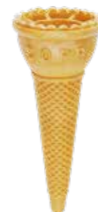
KINDER WAFFEL 46/115 168 STÜCK 51105