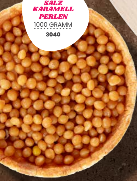
SALZ KARAMELL PERLEN 1000 GRAMM 3040