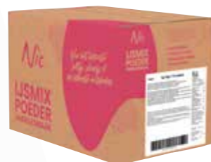
RELIZ 17 17% MILCHFETT KARTON 14 X 1 KILO 43830

Unsere neuen Verpackungen sehen nicht nur besser aus, diese sind auch noch haltbarer und einfacher im Handling. Genau diese Punkte waren uns auch wichtig bei der Entwicklung unserer neuen Verpackungen für unsere Eismix Pulver. Somit bestehen unsere neuen Kartons nun aus mindestens 70% recyceltem Material, der Karton ist FSC zertifiziert und wird auch nicht mehr gebleicht. Dabei haben wir uns auch für einen weniger farbintensiven Druck entschieden und in den meisten Fällen auch einen dünneren Karton. Dadurch, dass der Karton das gleiche Gewicht tragen muss, haben wir die Maße etwas verkleinert, sodass er stark genug bleibt. Für Sie umso besser, denn es erleichtert Ihnen das Handling. Kurz gesagt, dies ist nicht nur für Sie besser, sondern auch für die Umwelt.