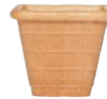
ECKIGE BECHER 56/48 304 STÜCK 51133