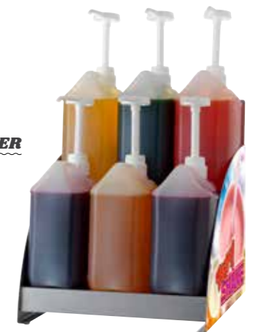
SHAKE DISPENSER 95120