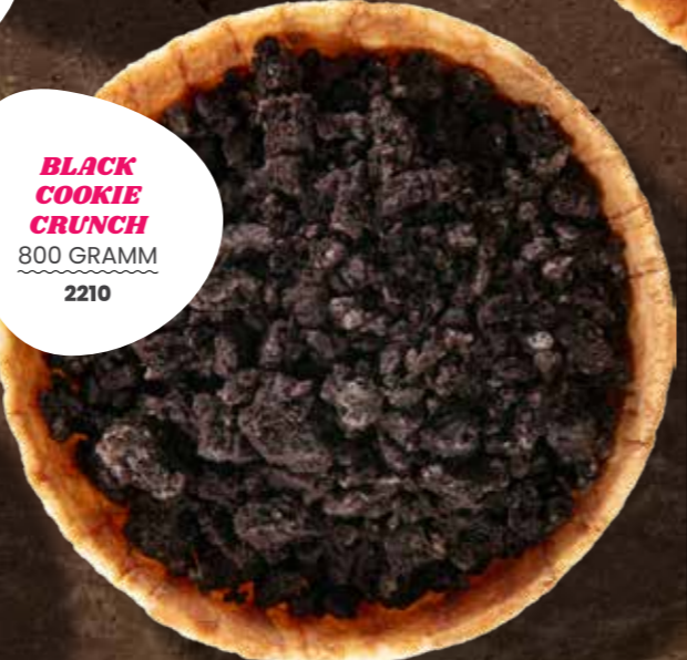
BLACK COOKIE CRUNCH 800 GRAMM 2210