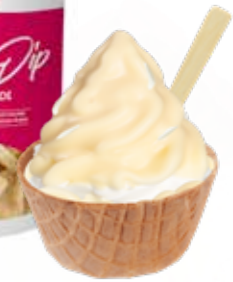
WEISSE SCHOKOLADE 1200 GRAMM 2820