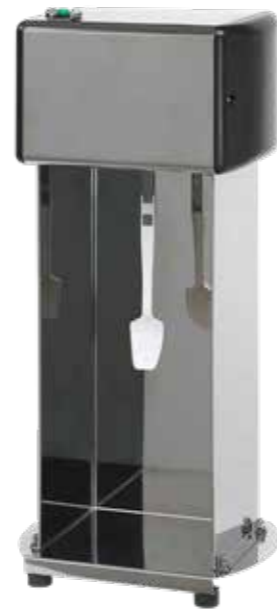
SHUFFLE MIXER 95150