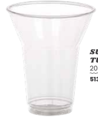
SUNDAE BECHER TULP 300 ML 20 X 50 STÜCK 51340