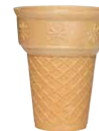
RIESEN BECHER 68/72 120 STÜCK 51134