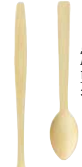
SUNDEA LÖFFEL AUS BAMBUS 12,5 CM 1000 STÜCK 39130