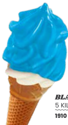
BLAUES MONSTER 5 KILO 1910