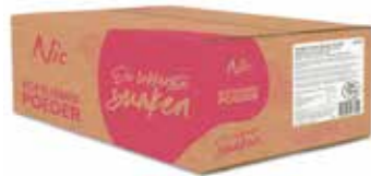
ERDBEER 5% MILCHFETT KARTON 10 X 1 KILO 43710

Softeis in unterschiedlichen Geschmacksrichtungen ist trendy! Neben Vanille- und Sahnesofteis bietet Ihnen NIC darum auch Softeis in anderen Geschmacksrichtungen an. Auffallende Farb- und Geschmackskombinationen in einem fetzig dekorierten und gedrehten Hörnchen. Der Kunde von heute probiert gerne neues aus und will dabei auch gerne die unbekannteren Geschmacksvarianten probieren. Je kreativer, desto besser. Dies wirkt sich noch besser auf Ihre Kundschaft und natürlich Ihre Marge aus.