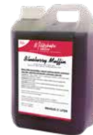
BLUEBERRY MUFFIN 2300 GRAMM 60640