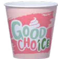
SHAKE / EISBECHER SMALL 300 ML 20 X 50 STÜCK 35210