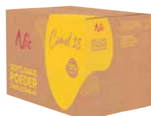
COMEL 18 18% MILCHFETT KARTON 14 X 1 KILO 43810