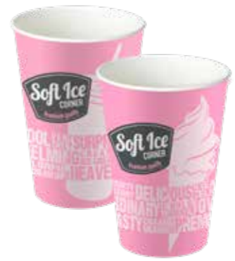
SHAKE / EISBECHER MEDIUM 400 ML 20 X 50 STÜCK 33020