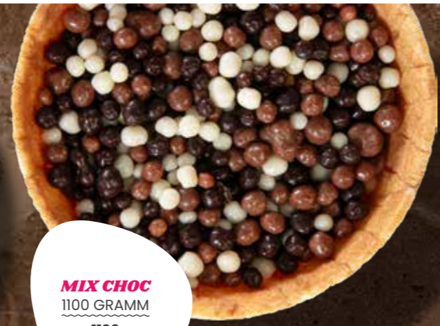
MIX CHOC 1100 GRAMM 1100