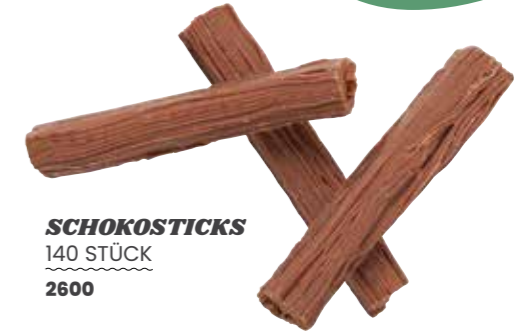
SCHOKOSTICKS 140 STÜCK 2600