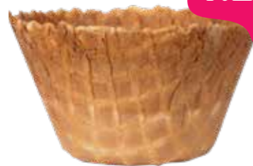
DÄNISCH LARGE CUP 97/55 240 STÜCK 51122