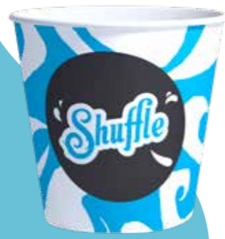
SHUFFLE BECHER 300 ML 20 X 50 STÜCK 32600

FÜR ALLE KONZEPTE EINE EIGENE AUFFALLENDE TEILKARTE!