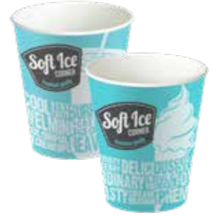
SHAKE / EISBECHER SMALL 300 ML 20 X 50 STÜCK 33010