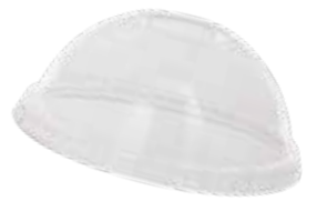
DECKEL TULPEN BECHER 10 X 100 STÜCK 51335