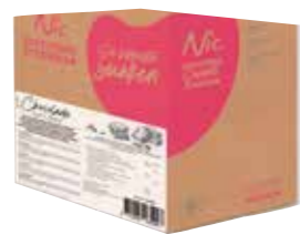
SCHOKOLADE 7% PFLANZFETT 1 X 10 LITER / 11 KILO 43690