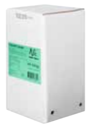
YOGHURT 3,5% MILCHFETT 1 X 5 LITER / 5,5 KILO 43662