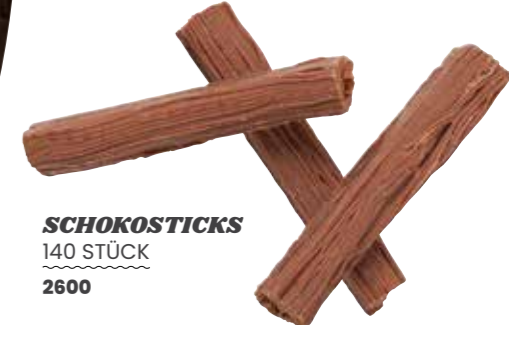
SCHOKOSTICKS 140 STÜCK 2600