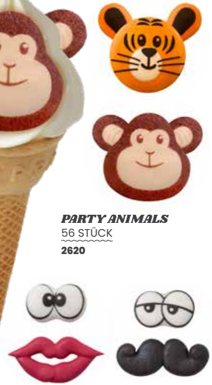
PARTY ANIMALS 56 STÜCK 2620