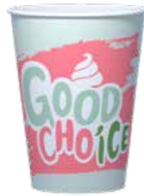
SHAKE / EISBECHER MEDIUM 400 ML 20 X 50 STÜCK 35220