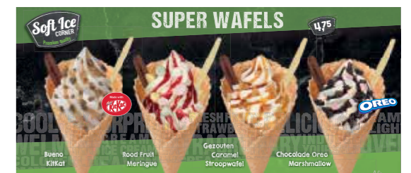
TEILKARTE SUPER WAFFEL SOFTICE CORNER*