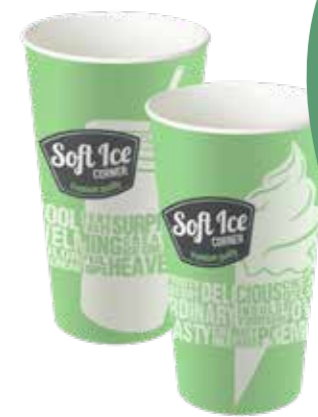
SHAKE / EISBECHER LARGE 500 ML 20 X 50 STÜCK 33030