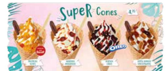
TEILKARTE SUPER WAFFEL GOOD CHO'ICE*