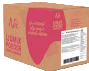
FLEVO 16,4% PFLANZENFETT-/MILCHFETT KARTON 14 X 1 KILO 82040