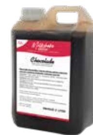
SCHOKOLADE 2300 GRAMM 60230