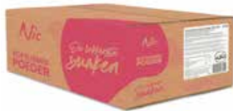
SCHOKOLADE 10% MILCHFETT KARTON 10 X 1 KILO 43720